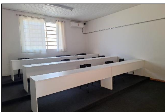
Sala para aulas de música e canto coral. Data: 05/07/2024