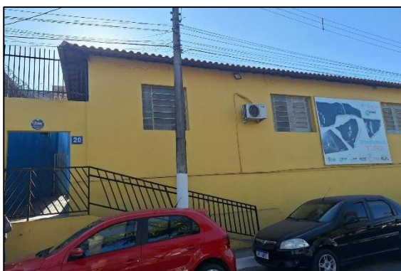
Sede da Fundação Dirce Figueiredo Autoria: Luísa Mosqueira Data: 05/07/2024