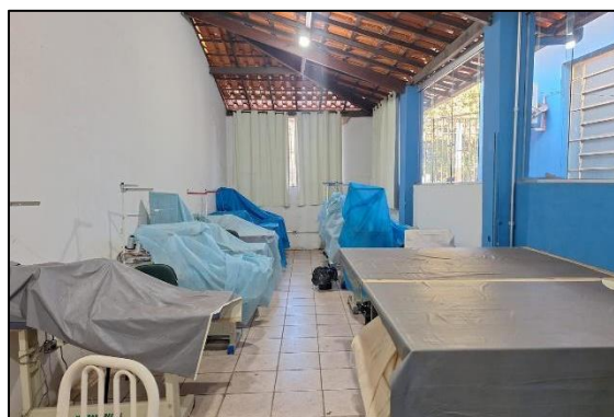
Área para aulas de costura. Autoria: Luísa Mosqueira Data: 05/07/2024