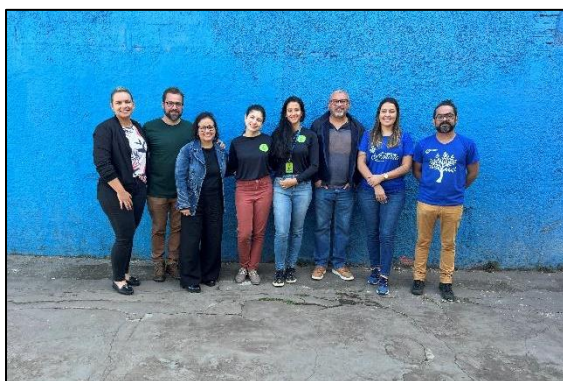
Equipes Semente e Fundação Dirce Figueiredo. Data: 05/07/2024

O projeto está no quarto mês do cronograma e apresenta doze meses, no total, de execução. Para esse mês, estão previstas apenas as aulas de marimba e canto coral, que foram acompanhadas por meio da visita técnica. Com isso, foi possível constatar que o projeto está em andamento e sendo executado de forma satisfatória e adequada, com as ações dentro do cronograma.