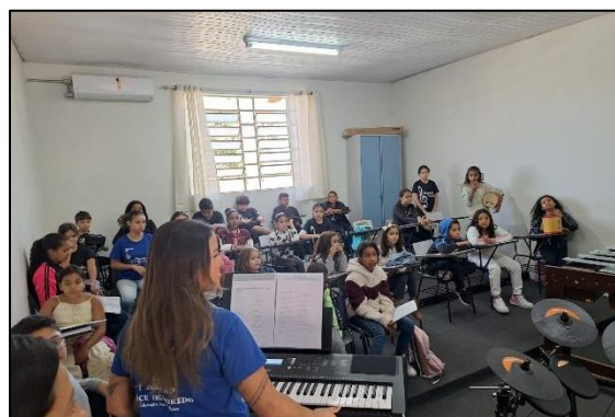
Aula de canto coral e marimba. Data: 05/07/2024