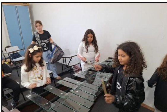
Alunas tocando marimba. Data: 05/07/2024