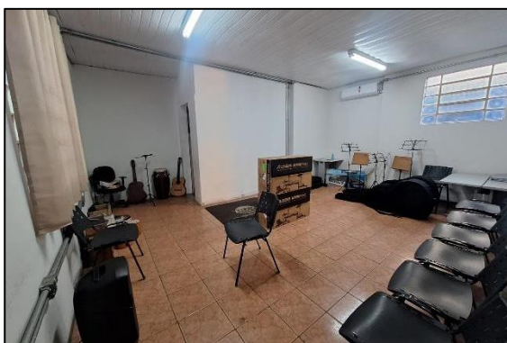
Sala para aulas e armazenamento de instrumentos. Data: 05/07/2024