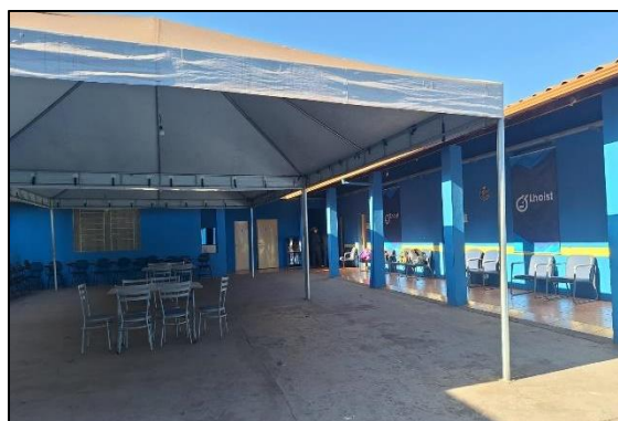
Pátio da sede da Fundação Dirce Figueiredo Data: 05/07/2024