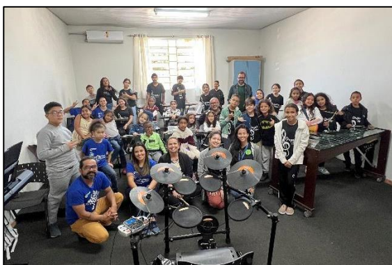
Aula de canto coral e marimba. Data: 05/07/2024