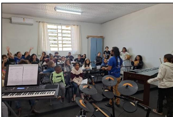
Aula de canto coral e marimba. Data: 05/07/2024

Após a reunião, as equipes foram para a sala onde estava ocorrendo aulas simultâneas de marimba e canto coral. Nesta manhã, estavam presentes 11 dos 16 alunos matriculados para a marimba e os 16 alunos do canto coral. Foi preparada uma apresentação por parte dos alunos e professores, que foi treinada durante a manhã. Por meio da apresentação, foi possível observar que, apesar das poucas aulas que já foram ministradas, as crianças participantes estão progredindo rapidamente nos aprendizados musicais com o projeto.